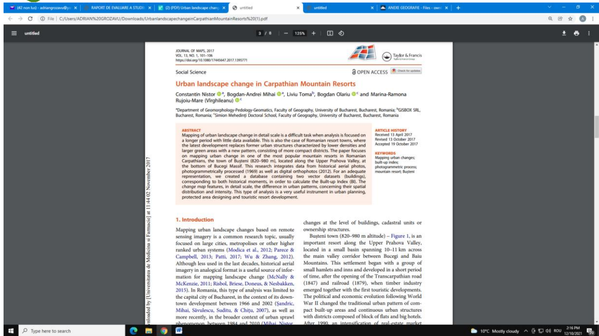
Printscreen Dovada cercetare științifică studenți - Articol publicat în revista Journal of Maps , revista cotate ISI (Web of Science); Accesat la data de: 25.11.2021