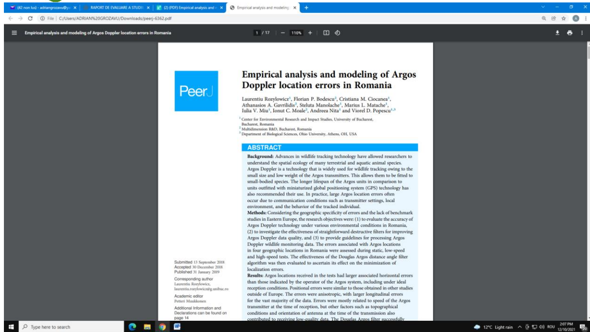
Printscreen Dovada cercetare științifică studenți - Articol publicat în revista PeerJ , revistă cotate ISI (Web of Science); Accesat la data de: 25.11.2021