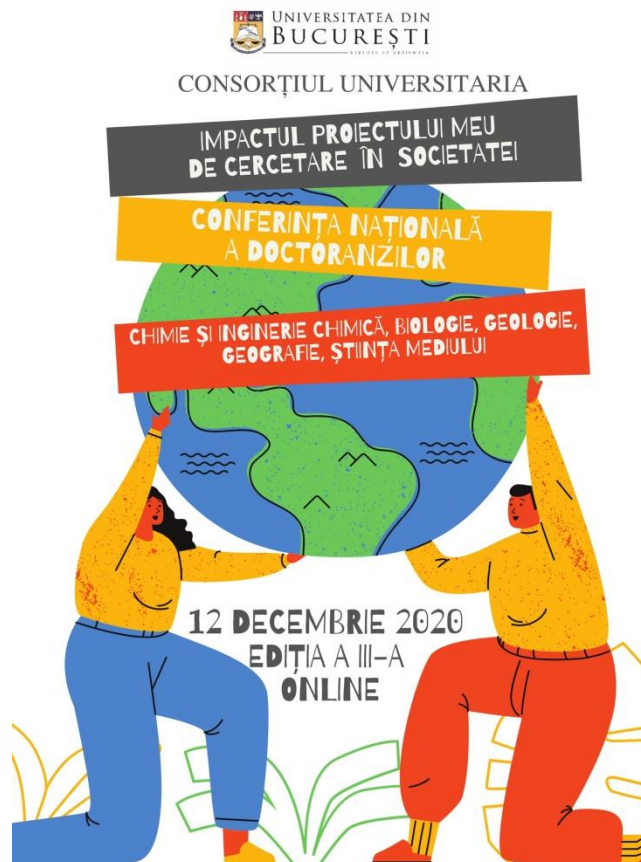
Printscreen Dovada activitati studenti – organizare Conferința Națională a Doctoranzilor ; Accesat la data de: 25.11.2021 ( https://conferinte.doctoranzi.geo.unibuc.ro/ )