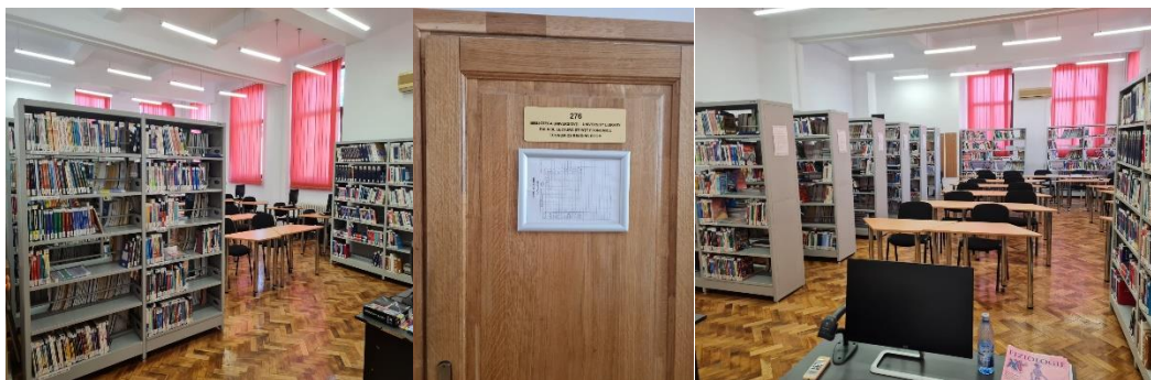
Biblioteca universitară – Sală de Lectură