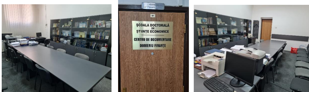
Școala Doctorală de Științe Economice – Centrul de documentare Domeniul Finanțe

În cadrul vizitei au fost stabilite întâlniri și discuții (atât on-line, organizate pe platforma Zoom, cât și față în față în timpul vizitei la fața locului) cu diferite categorii de persoane implicate în procesul didactic și de cercetare, respectiv întâlnire/discuții cu studenții doctoranzi, absolvenții, reprezentanți ai angajatorilor acestora, conducerea SDSE, responsabilul domeniului Finanțe, conducătorii de doctorat, reprezentanții diferitelor structuri ale universității din domeniul de studii universitare de doctorat evaluat, precum directorul și membrii Consiliului Școlii Doctorale de Științe Economice , astfel: