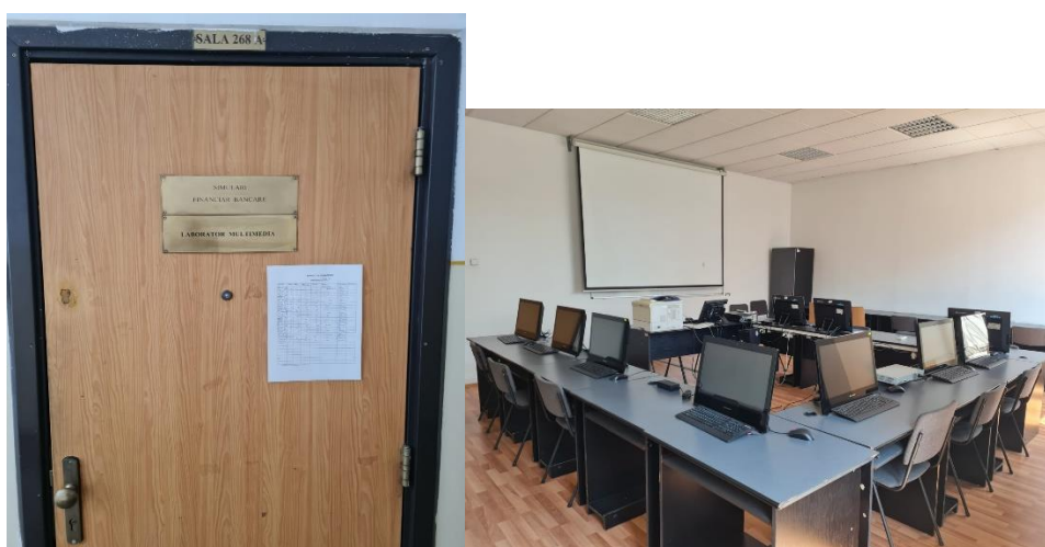
Laborator Simulări financiar bancare