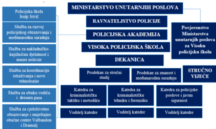
Slika 1. Shematski prikaz VPŠ u sustavu Ministarstva unutarnjih poslova prema Uredbi o unutarnjem ustrojstvu (Narodne novine, br. 7/2022)