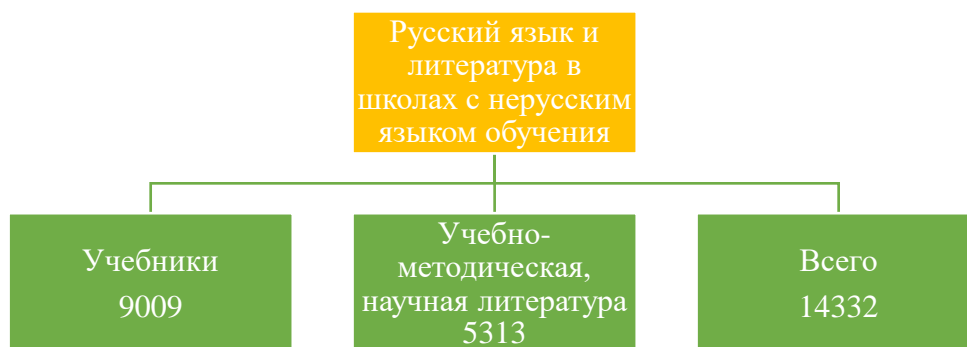
Рисунок 1 – Фонд учебной и научной литературы (в разрезе ОП)

Комиссия отмечает, что во всех корпусах института и общежитиях работают зоны WI-FI.