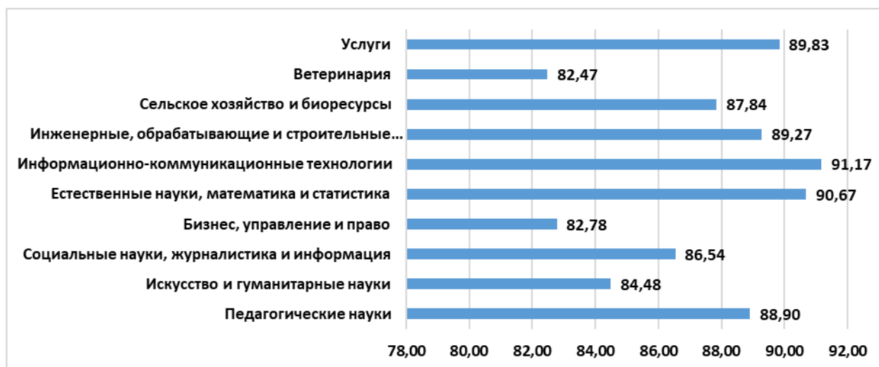
Рисунок 2 - Показатель трудоустройства по направлениям подготовки

Трудоустройство выпускников ежегодно рассматривается и обсуждается на Ученом Совете университета, где принимаются решения по оптимизации и улучшению процессов эффективного карьерного старта и трудоустройства выпускников. В 2020 году из-за пандемии наблюдался самый низкий показатель трудоустройства – 84,02%.