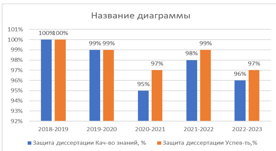
Рисунок 5.4 – Результаты итоговой аттестации, магистратура