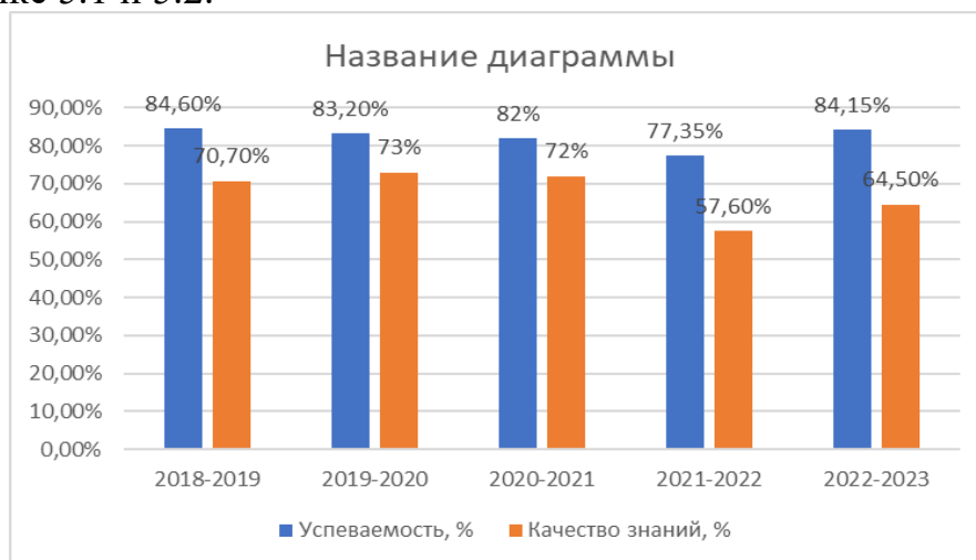
Рисунок 5.1 – Результаты промежуточной аттестации, бакалавриат

Статистика успеваемости обучающихся за последние 5 лет приведена на рисунке 5.1 и 5.2.