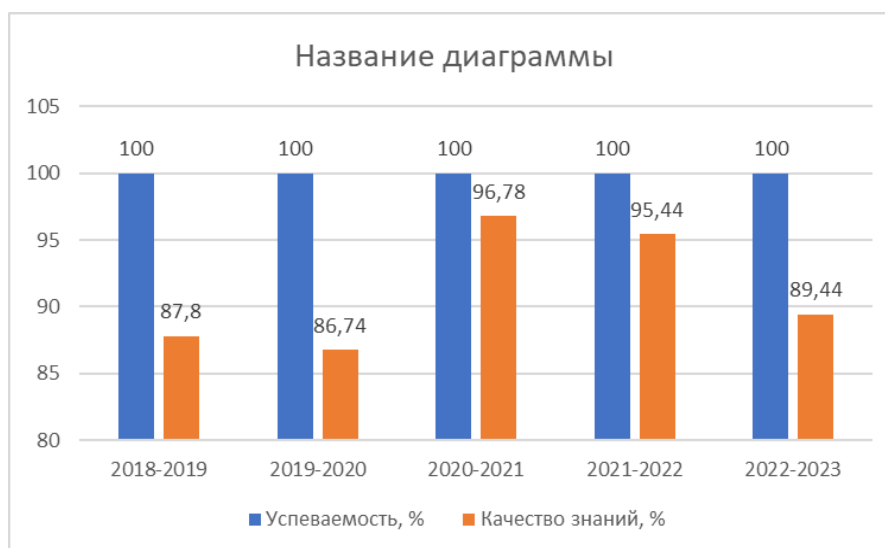
Рисунок 5.3 – Результаты итоговой аттестации, бакалавриат

Статистика по результатам итоговой аттестации обучающихся за последние 5 лет приведена на рисунке 5.3 и 5.4.