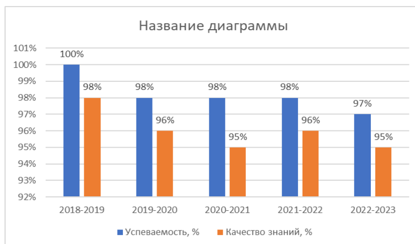
Рисунок 5.2 – Результаты промежуточной аттестации, магистратура

Анализ приведенных гистограмм показывает некоторое повышение показателей успеваемости и качества знаний в бакалавриате при практически постоянных в магистратуре за последние 4 года.