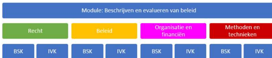
Figuur 2 schematische weergave opbouw module

vakmanschap, rampenbestrijding en risicobeheersing. Hieronder is de opbouw van een module schematisch weergegeven.