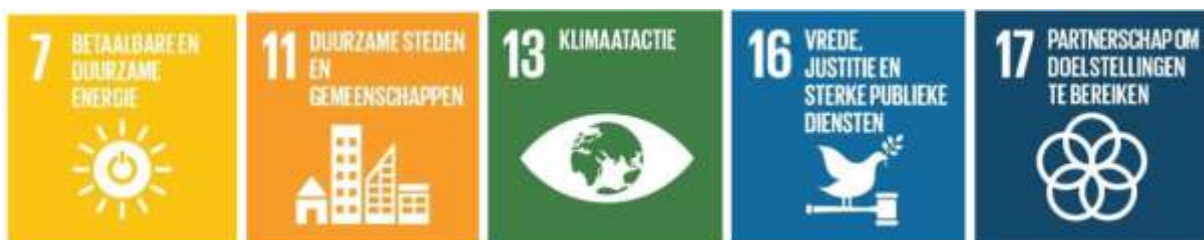
Figuur 3 Sustainable Development Goals

Zoals bij de voorgaande criteria is aangegeven onderscheidt de opleiding twee aspecten van duurzame ontwikkeling; duurzaam handelen en thema's die inhoudelijk betrekking hebben op duurzame ontwikkeling. Het panel onderschrijft het standpunt van de opleiding dat beleid waarbij rekening wordt gehouden met het gehele systeem gelijk is aan duurzaam beleid. Het panel ziet met name in de integrale leerlijn en in de kennisleerlijn dat de opleiding rekening houdt met de duurzame aspecten van beleid en het functioneren als bestuurskundige. Daarnaast werken studenten door de gehele opleiding heen aan duurzaamheidsvraagstukken die uit de beroepspraktijk afkomstig zijn. De opleiding heeft verschillende onderwijsonderdelen en beroepsproducten specifiek gekoppeld aan Sustainable Development Goals. Dit betreft de volgende SDG's: