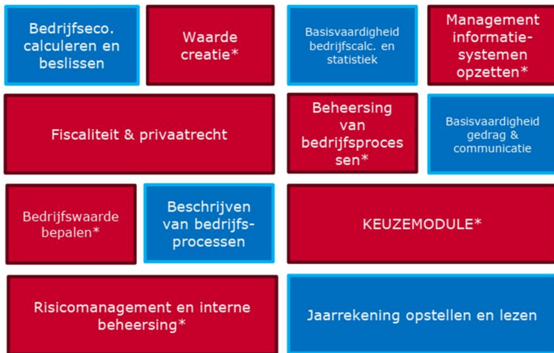
Figuur 1, individuele samenstelling programma Ba F&C (presentatie opleiding bij visitatie)

De modules omvatten een afgebakend kennisdomein, bijvoorbeeld bedrijfscalculatie of recht. Er zijn geen doorlopende leerlijnen meer gedurende de opleiding, zoals voorheen het geval was. Het panel concludeert dat de inhoud van het programma goed is uitgewerkt. Voor elke module is een uitgebreide en informatieve modulewijzer opgesteld, die via de elektronische leeromgeving Brightspace beschikbaar is.