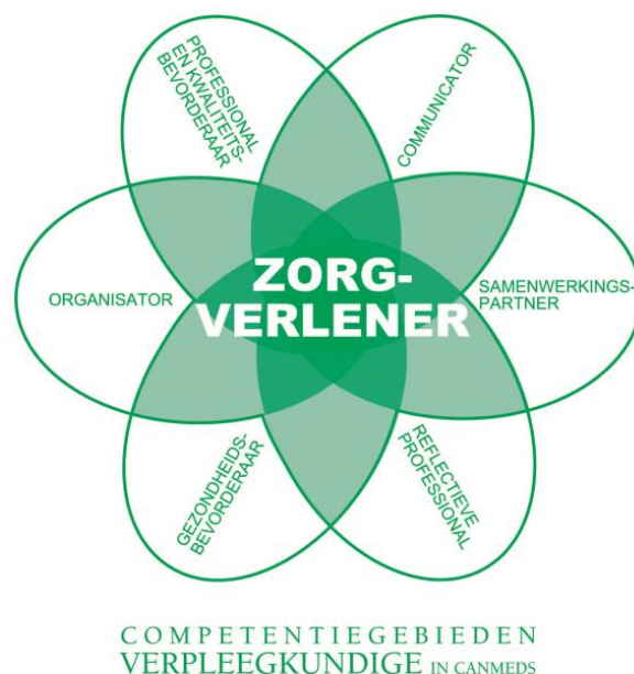
Figuur 1: Competentiegebieden Verpleegkunde, (Bachelor of Nursing 2020 (2015)).

Het Opleidingsprofiel BN2020 beschrijft zestien competenties die zijn geordend volgens de zeven internationale competentiegebieden van de Canadian Medical Education Directions for Specialists (CanMEDS) en het International Classification of Functioning, Disability and Health (ICF). Deze zeven competentiegebieden of rollen zijn apart van elkaar beschreven maar zijn onlosmakelijk met elkaar verbonden. De rol van zorgverlener vormt de kern van de verpleegkundige. De overige zes CanMEDS-rollen ondersteunen de centrale rol zoals is weergegeven in figuur 1.