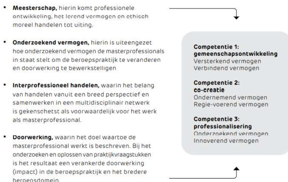
Figuur 1. Relatie tussen master-pijlers Vereniging van Hogescholen en competenties/vermogens opleiding Community Development

Voor het realiseren van deze beroepsopgaven zijn drie competenties op masterniveau en zes onderliggende vermogens belangrijk. De drie competenties zijn binnen de visie van het hbo op een brede professionaliteit en op basis van het niveau van de drie kerntaken van sociaal werk (Landelijk Opleidingsdocument Sociaal Werk, 2017) geformuleerd (zie figuur 1).