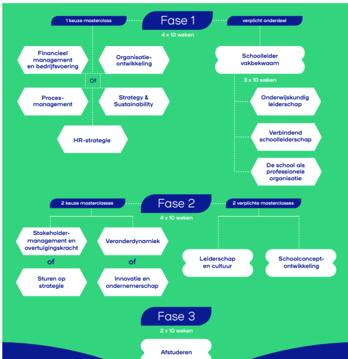
Figuur 1: curriculumstructuur Master Leiderschap in Onderwijs Avans+

Uit de beoordeling van het Experiment Leeruitkomsten uit 2022 zijn aanbevelingen gekomen die onder andere betrekking hadden op de oriëntatie op het po, de samenhang in het programma en de variatie in toetsing. In de korte tijd die sinds de evaluatie van experiment verstreken is, heeft de opleiding vanzelfsprekend niet al deze aanbevelingen kunnen implementeren. Wel heeft de opleiding duidelijk verbeteringen in gang gezet, vooral ten aanzien van kalibratie en samenhang. Bij de uitwerkingen van de standaarden worden deze verbeteringen toegelicht.