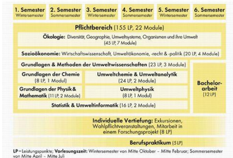
Abb. 2: Aufbau des Bachelorstudiengangs Umweltwissenschaften

Der Bachelorstudiengang Umweltwissenschaften ist ein interdisziplinär ausgerichteter Studiengang mit naturwissenschaftlichem Schwerpunkt. Er ist national ausgerichtet, einzelne Lehrveranstaltungen können jedoch auch in englischer Sprache angeboten werden. Er besteht aus 22 Pflichtmodulen (155 Leistungspunkte), einem Modul „Individuelle Vertiefungen“ (acht Leistungspunkte) mit Wahlpflichtveranstaltungen, einem Berufspraktikum (fünf Leistungspunkte) und der abschließenden Bachelorarbeit mit Kolloquium (zwölf Leistungspunkte) (siehe Abb. 2).